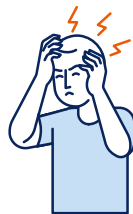
Maux de tête